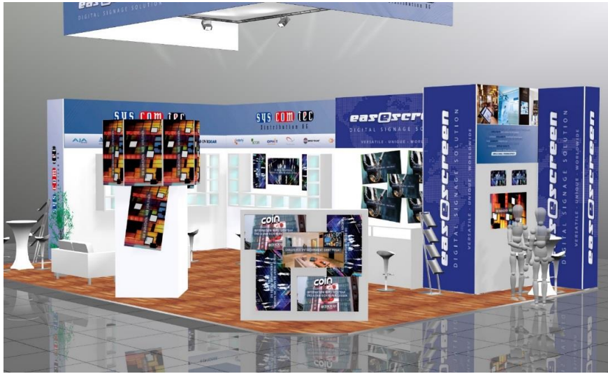
Exklusiv auf der ISE 2016 veröffentlicht easescreen das Upgrade V9 und präsentiert Neuerungen im Bereich von Soft- und Hardware (8-N275)