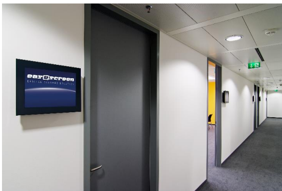
EURO PLAZA, Wien: Wegleitung und Türbeschilderung