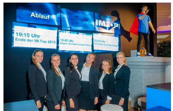
Frame-synchrone Wiedergabe von unlimitiert vielen Playern sowie beliebig positionierbare Displays innerhalb einer Videowand