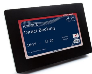
eSign Touch – die neue easescreen Hardware im Bereich digitale Wegeleitung