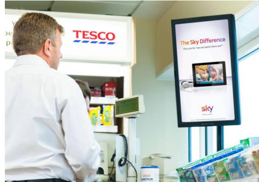
in Supermarkt- und Gastronomie-Ketten ...