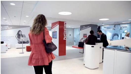
easescreen und Quividi im Einsatz bei Banken & Versicherungen...