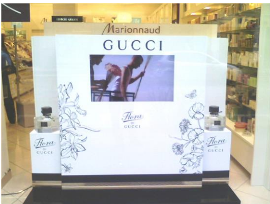
im Fachhandel ...