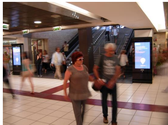
im Transportwesen wie Bahnhöfe oder Flughäfen... und viele mehr