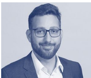
eCP 2, eNE, eCE, eRE: