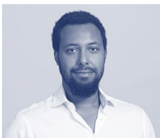
eCP 1, eCA 1: