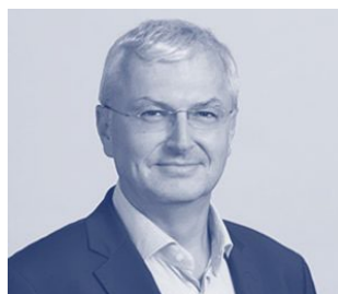
eCA 2 (Deutsch):